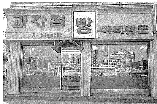
◀ 「아비양또」, 젊은 박창수씨의 꿈이 영글어 가는 곳이다.