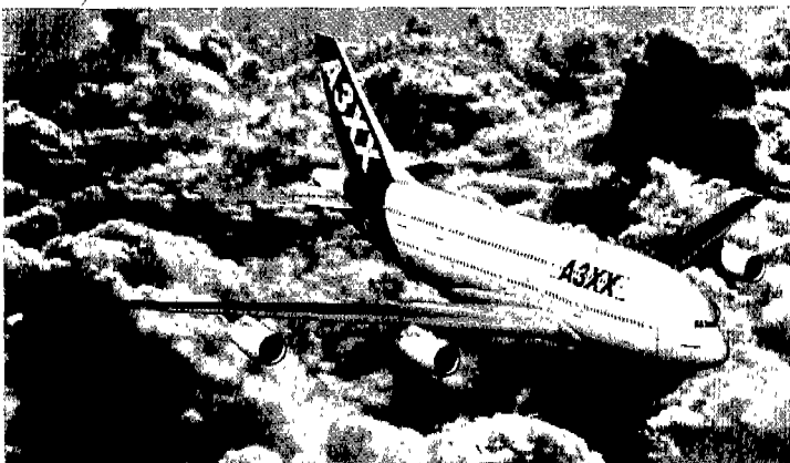
여객/화물기 콤비기종으로 제작 구상중인 A3XX