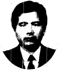
이 봉 길 해양경찰청방제과

동해에 면한 일본 서부해안에는 지난 '97. 1. 2 발생한 러시아 유조선 NAKHODKA호에 의한 오염사고로 오염이 심각하며, 아직도 방제작업이 한창이다.