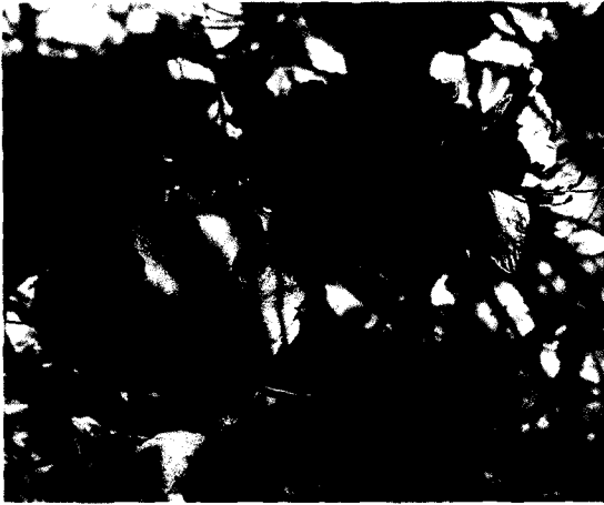
▲산을 불태워 버린다는 진달래. 북한산. 1985. 4. 9