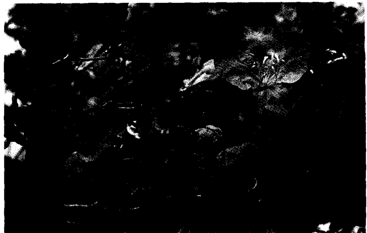
▼무더기로 피어나기를 즐기는 진달래. 북한산. 1985. 4. 9

“신라 선덕왕 때, 순정공(純貞公)이 강원도 강릉 태수(太守)로 부임해 가는 도중 바닷가에서 점심을 먹고 있었는데 곁에 돌산이 병풍처럼 깎아서 있었고 그 높이가 천 길이나 되었다. 그 돌산 높