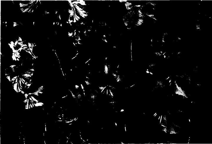
▲색채의 예술인 진달래꽃. 도봉산. 1984. 4. 15