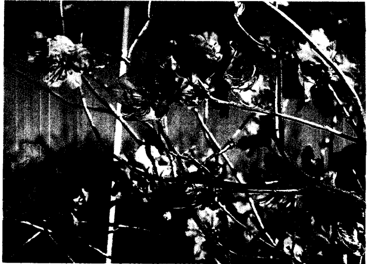
▲두견새가 피를 토해서 물들었다는 진달래. 북한산. 1985. 4. 9

환제이다. 지난 날, 가마꾸라(鎌倉), 무로마찌(室町), 아쓰지모모야마(安土桃山), 애또(江戸) 시대에는 천황을 제쳐 두고, 무인들이 나라의 실권을 잡아 정치를 했다. 이 시대가 바로 막부(幕府) 시대이다. 막부시대의 인물로 오다노부나가(織田信長), 도요토미 히데요시(豊臣秀吉) 그리고 도쿠가와이에야스(徳川家康)가 있음은 일본역사에 조금의 관심이 있는 사람들에게겐 알려지고 있다. 이 세 사람 장군의 성격을 다음과 같이 견주고 있다는 것은 흥미롭다.