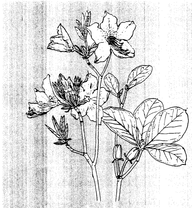
▲철쭉꽃을 단 가지(왼 쪽) 열매를 단 가지(오른 쪽) (그림출처 : 나카이, 조선삼림식물편)