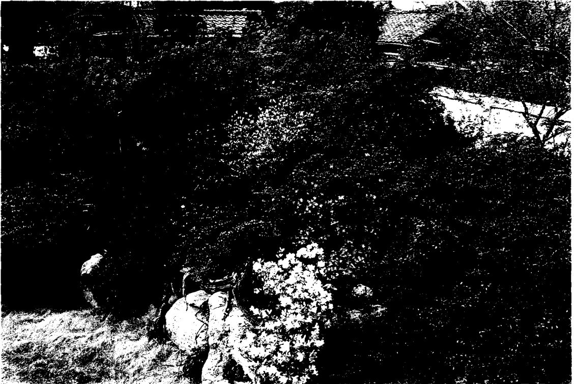
▲진달래 정원, 전북 익산시내, 1989. 4. 22