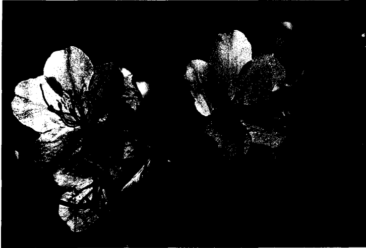
▲화전놀이 재료가 되는 진달래. 도봉산. 1984. 4. 15

은 곳에 철쭉 꽃이 활짝 피어 있었다. 이 때 순정공의 부인인 수로가 좌우를 돌아보면서 ‘누가 저 꽃을 꺾어 오겠는가?’ 하니, 시중 드는 사람들이 ‘산이 너무 험해서 할 수 있는 일이 아니라’고 대답했다. 이 때 마침 암소를 끌고 그곳을 지나던 한 노인이 부인의 말을 듣고 꽃을 꺾어 노래와 함께 바쳤다는 것이다.