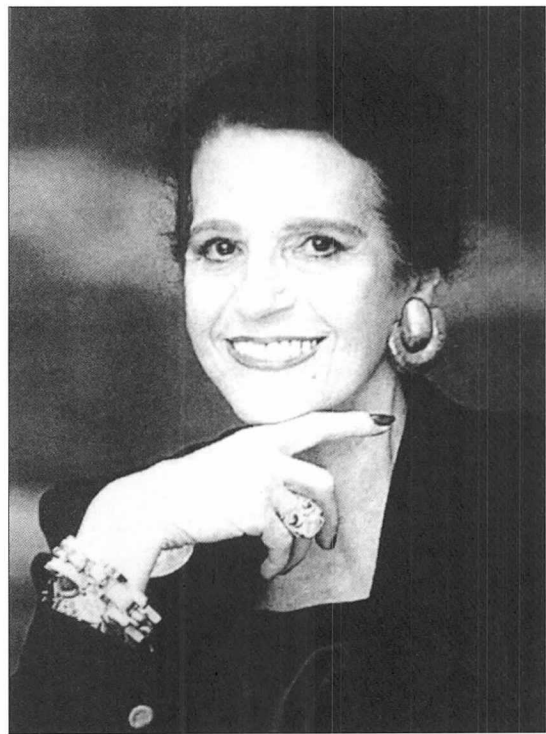
프랑스 소설가이자 문학비평가인 저자 비비안느 포레스테.

대중매체의 경제 기사와 경제에 관한 대중화 저작(popularizer) 몇 권을 읽으면, 경제문제에 대해서 전문가로서 얘기할 자격을 얻는다고 생각하는 사람들은 어느 사회에나 드물지 않다. 우리 사회에서도 마르크스주의 서적 몇 권을 읽고 우리 경제 체제에 대해 열정에 찬 비판을 퍼붓는 것이 젊은 세대의 본분이자 특권으로 여겨진 적이 있었다.