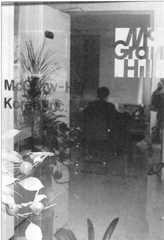
맥그로힐 출판사의 한국 지사.

로 시장성을 조사했다가 포기했다는 후문이고, 독일의 유수 출판그룹 베텔스만이 국내에 북클럽을 형성해 국내의 서적을 망라한 무점포 판매를 기획중인 것으로 알려졌다.