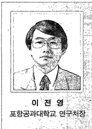
이 전 영 포항공과대학교 연구처장

미국의 많은 대학들은 대학재정을 확충하고 지역 경제 발전을 목적으로 생명공학, 신소재, 정보통신 등의 첨단 기술분야의 연구결과를 상품화하는 새로운 형태의 산학협동체제를 모색하고 있다. 기존의 산학협동체제가 대기업과 대학을 중심으로 이루어진데 반하여 새로운 산학협동체제는 대학과 대학인근의 중소기업간에 이루어지고 있다. 기존의 산학협동체제에서는 대학의 연구결과를 상품화하는 대부분의 대기업들이 대학 및 지역사회와 지역적으로 떨어져 있어서 대학의 우수한 연구결과가 지역사회에 아무런 공헌을 하지 못했다. 그러나, 새로운 산학