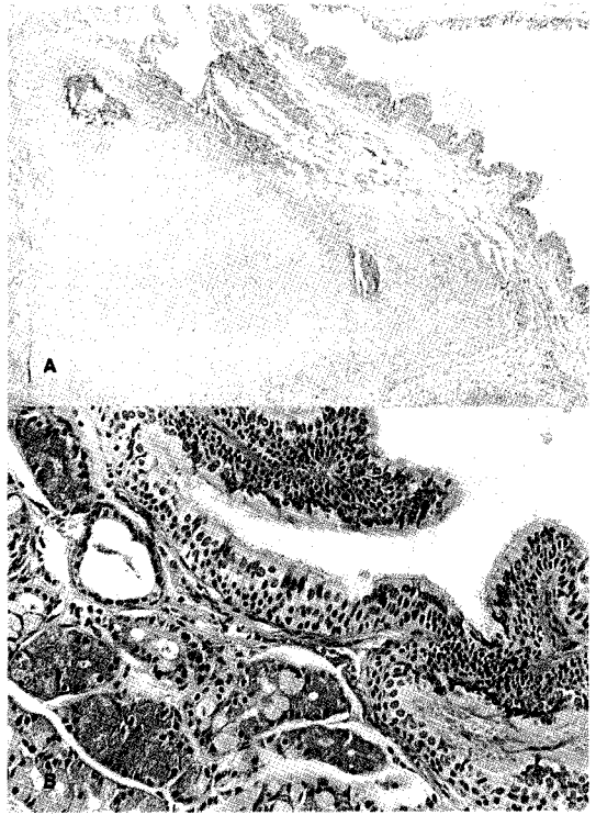
Fig. 2. Microscopic findings(H-E stain. A : ×40, B : ×400) : The wall of the cyst contained a portion of mature cartilage(A). The cystic mass was lined with ciliated columnar epithelium and showed a plaque of mucous glands in the wall(B).

Batholinus 1) 가 최초로 1678년 4세된 남아의 폐 좌상엽에 발생한 폐 낭종을, Maier 2) 가 1859년 종격동에 발생한 기관지성 낭종을 보고한 이후로 기관지성 낭종은 매우 희귀한 선천성 질환으로 알려졌으나 최근들어 진단방법이 발달하면서 증세가 없는 환자에서도 수술을 시행하는 적극적 치료원칙이 도입된 이래 점차 진단 및 치료가 증가하는 추세이다.