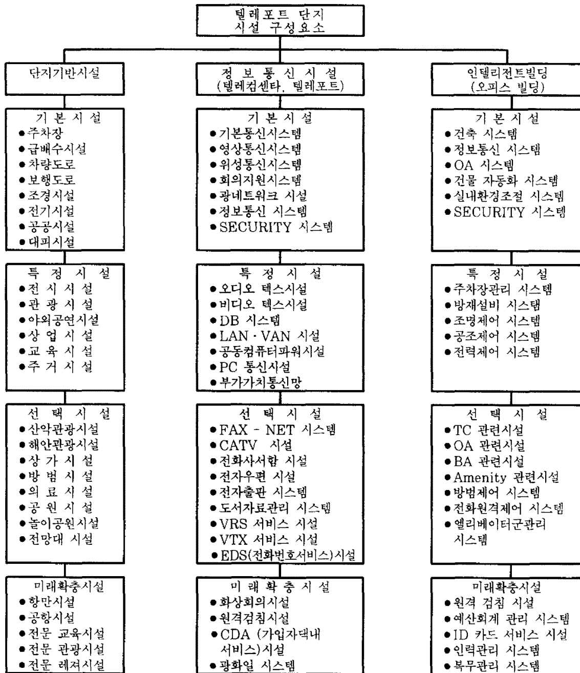
Table 3 Constituents of teleport town

이를 종합하면 「국내 텔레포트단지는 해안이나 내륙지방의 평활지에 도심과의 연계가 가깝고 저지가 지역로서 개발이 용이한 도시근교의 대규모 지역에 개발되며 사회기반시설의 첨단화가 이루어지고 업무·상업기능을 중심으로 순수 정보통신설비가 단지의 중심에 배치되는 유형」이 표준 모델이라고 할 수 있다.