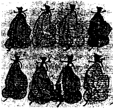
[그림 1] 단령을 입은 금제자