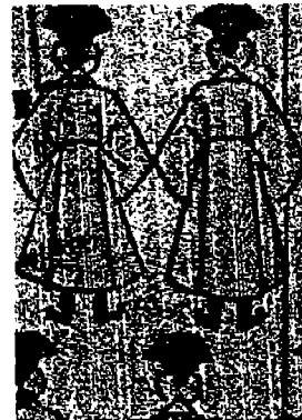
[그림 4] 도포를 입은 유생 출처: 「왕세자 출궁도」