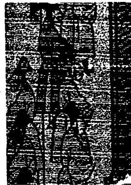
[그림 5] 직령을 입은 유생 출처: 「왕세자 출궁도」