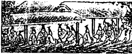
[그림 2] 홍직령을 입은 유생

영조대에는 유생복에 청금을 착용하자는 대한 논의가 더 활발해졌다. 그런데 9년 趙明翼의 상소 54) 와 그에 따른 수차의 논의 55) 등의 내용을 보면, 정해진 기일내에 중국제도에 맞춰 새 제도를 시행하기에 기일이 급박하여 개선하지 못한 것과 56) 현종 때에 만들기로 한 분포 청금, 복두로 거재의복을 삼고 금제자도 그 예를 따르되 어사화를 꽃게 하지는 의견으로 보아 이러한 제도들이 아직도 시행되지 못했음을 추측해 볼 수 있다. 뿐만 아니라, 또한 그 때까지 관학(館學) 유생이 거재 57) 할 때와 부거(赴學) 58) 할 때 모두 홍단령을 입어 왔음을 알 수 있다 59) . 그러나 이들 유생들이 불편히 여겨 번번이 「詩經」의 “靑靑子衿”이란 구절을 인용하면서 청의 입기를 원하였고, 그럼에도 불구하고 쉽게 고치지 못하고, 유생의 복색은 그대로 홍단령을 쓰게 명하였다 60) . 여기에서 홍단령이 언제부터 유생복으로 쓰였는지 의문이 나 적어도 광해군 이전(주 47 참조)부터 사용되어 온 것을 알 수 있다.