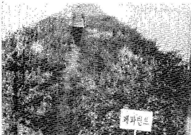
<그림 2> Herb test-growing in the Environmental Office