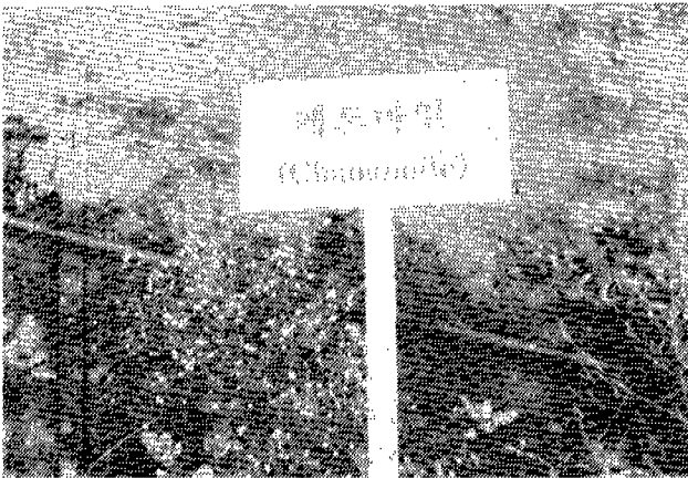
<그림 1> Herb test-growing in the Agricultural Promotion Institute

5) 허브의 생산 및 가공제품 판매계획에 대한 개발구상으로는 각 시 군에서 농가 및 가공업자를 선정하고, 생산