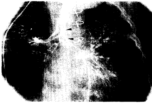
Fig. 3. Postoperative bronchography. It shows widely patent shortened distal trachea(between arrow heads) compared preoperative trachea in Fig 1.

예방하는 목적으로 사용했다. 피부 봉합후 턱과 가슴을 잇는 문합을 하여 경부가 전굴 상태로 있도록 하여 문합 부위에 과도한 긴장이 가해지지 않도록 했다. 문합후 환기는 매우 순조로웠고 호기가스 배출도 쉬웠으며 PaCO 2 는 35~40 mmHg으로 유지되었다.