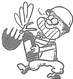
★ 소화기의 사용방법을 알고 설치합니다.