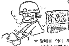
★ 담배를 입에 문채로 작업을 하지 않습니다.