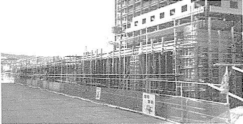
거푸집작업 안전을 위한 난간대를 외주부에 설치한 광경

거푸집 공사의 경우 동바리 설치간격은 물론 장선과 멩에의 규격과 간격도 사전 구조계산을 실시하여 안전성에 대한 검증을 받은 다음 시공함은 물론, 구조체를 형성하는 레미콘에 대해서는 제조과정에서부터 운반, 타설 및 양생까지 규정을 준수하여 소요강도 이상으로 확실하게 유지함으로써, 시공자의 무한책임 측면에서 콘크리트에 대해서는 타설부위별로 영구보관용 콘크리트 공시체를 제작하여 준공 후에 발주처에 넘겨주면 발주처는 향후 적정시기(100년 후라도)에 구조물의 안전도를 부위별로 체크할 수 있도록 하고 있다.