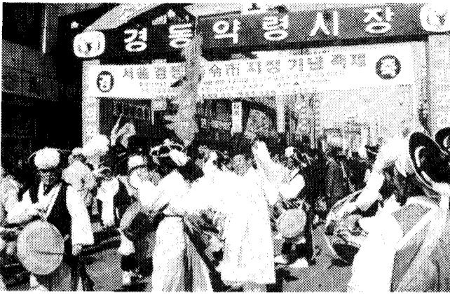
약령시의 날 기념 대축제가 6월1일 약령시장 일대에서 열렸다.

알뜰한 밀수황기 30류품. 인천세관은 얼마전 이틀 다시 외국으로 역수출하는 조건으로 재공매를 실시했으나 응찰자가 아무도 없어 처분여부를 두고 고심하고 있다. 이에 대해 인천세관측은 「농림수산부, 관세청