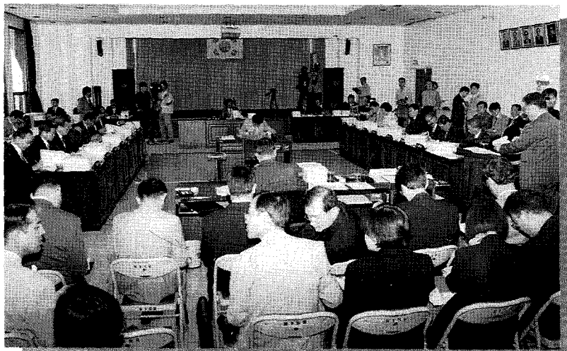
• 국회 보건복지위원회 국립보건원 국정감사

이러한 감염자 및 환자의 증가는 개인적으로 생명과 건강의 손실을 가져올 뿐만 아니라 국가적으로는 경제적·사회적문제를 야