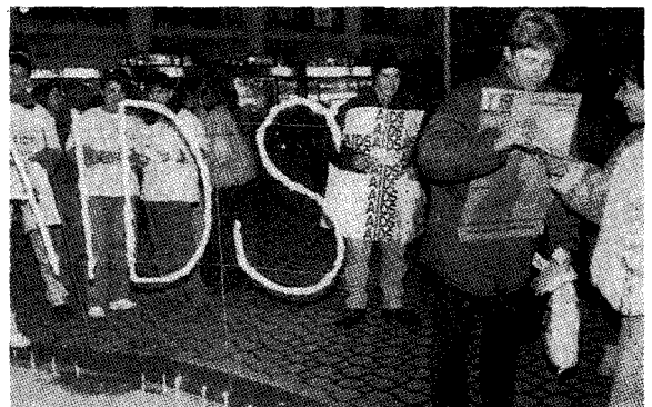
●헝가리 젊은이들의 촛불기원 행사.

빌 클린턴 대통령은 에이즈 치료법을 발견하기 위한 정부의 노력을 배증하겠다고 다짐하고 이와