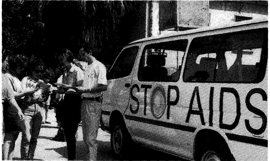
●홍보유인물을 배포하고 있는 자원봉사자들.

에이즈는 현재 25~44세 미국인들의 사인 1위를 차지하고 있으며, 젊은이, 여성 및 소수민족에게서 새 에이즈 감염자 수가 가장 빠르게 증대하고 있다. 미질병통제예방센터(CDC)는 최근 보고를 통해 에이즈 환자로 진단된 미국인이 50만명이고 사망자는 30만명이 넘는다고 말했다.