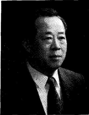
정종택 환경부 장관

지 금 우리는 세계화·정보화 시대와 함께 지구환경의 시대를 열어가고 있습니다. 다가오는 21세기는 “환경의 세기”가 될 것이라는 데 대해 전세계적으로 폭넓은 합의가 형성되고 있습니다. 환경의 세기에 한 나라의 환경보전수준은 바로 그 나라의 국가경쟁력과 삶의 질을 평가하는 잣대가 될 것입니다. 그러므로 우리나라가 21세기에 세계중심에 선 일류국가로 되려면 우선 환경모범국가가 되어야 하는 것입니다.