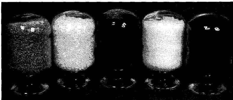
▲ 삼성종합화학이 생산하고 있는 수지

먼저 지난 5월 대만의 치메이사와 삼성 SM주식회사의 설립을 위한 합작투자 계약을 체결하고 총 200억원을 투자하여 SM주식회사를 설립했다. 한편 충남 대산 석유화학 단지내에 미국 레이시온사의 기술을