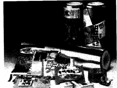
▲ 호남의 PP를 연신한 BOPP로 만든 식품 포장지

PO), 화성품(산화에틸렌, 에틸렌 글리콜), 올레핀(에틸렌, 프로필렌), 방향족, 산업용가스의 설계 제조 판매 및 서비스 부문이다.