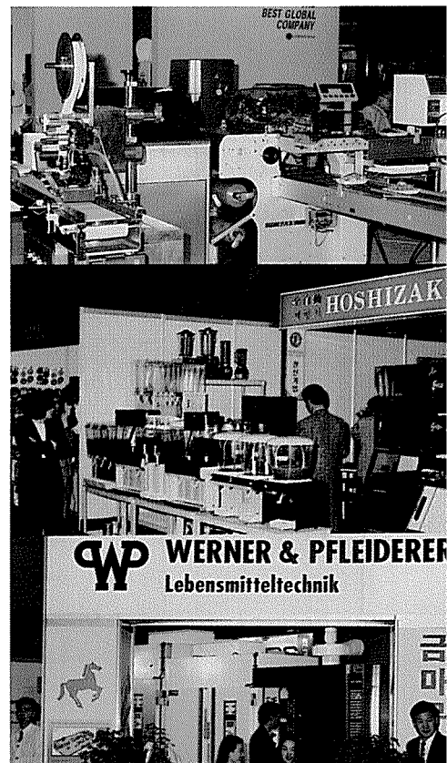
▶ 자동화 포장 기계류와 냉과류 기기가 기계 전시관의 주종을 이루었다.