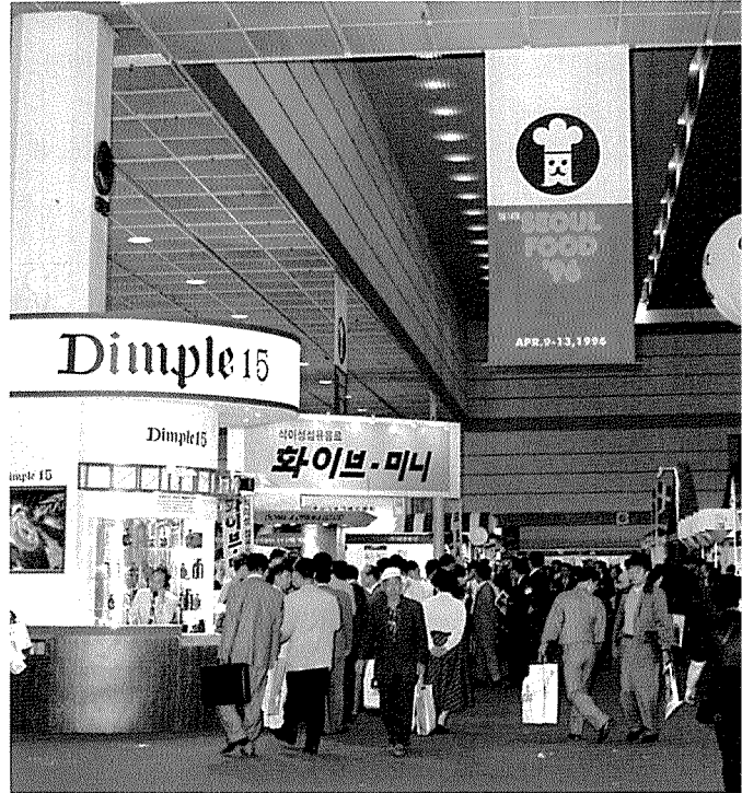
▲ 국내의 355개사가 참여해 전시 품목의 증가를 가져왔다.

경창정밀은 자동 제빵 성형기 4종을, 금마무역은 최근 독일 베르너 프라이어社로부터 수입한 오븐, 도우콘, 급속 냉동고를 선보였다. 대야상교는 기존 제과 기계류 외에 '다미아사업부'를 신설해 새로 취급하는 프랑스 '발로나'社 초컬릿을 선보여 눈길을 끌었으며 국내의 대표적 제빵기계 업체인 대영공업사는 신제품인 로타리오오븐과 생크림믹서, 설탕 공예기 등을 선보였다.