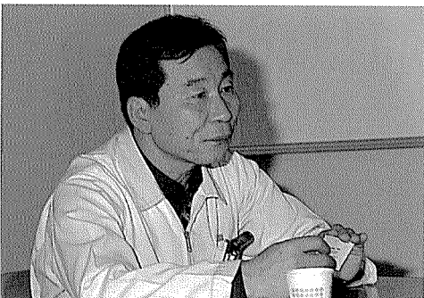
▲ 부지런한 손 동작이 그의 성격이 활발하다는 것을 대변하는 듯 하다. 그는 활기있는 20대 청년 못지않다.