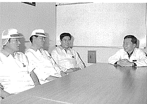
▲ 부하직원들은 그를 친형처럼, 친아버지처럼 여긴다. 도대체 어떤 얘기를 하길래 저렇게 즐겁게 웃고 있을까? 그는 확실히 분위기를 부드럽고 자유유롭게 만드는 ‘보이지 않는 힘’을 가지고 있다.