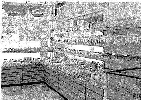
▲▲ 독특한 냉장쇼케이스의 모습. 다양한 제품이 전시되어 있다.