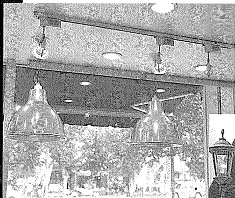
▲ 커다란 은빛의 종과 같은 형태의 조명. 제품이 돋보이게 한다. ▶ 요리사의 활기찬 동작이 그려진 상징 로고와 우아한 분위기의 등.