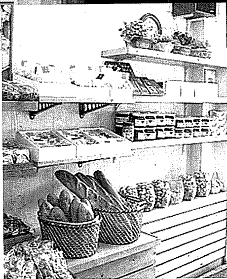
▲▲ 매장전경. 검붉은 색의 차양과 캔버스의 어울림이 신선하다. ▲ 입구에 위치한 아기자기한 선물을 과자코너.

위 치 : 서울특별시 노원구 상계동 651-5 골드시티B/D 101호 면 적 : 매장 10평, 공장 27평 인 원 : 매장-3인, 공장-6인 마감재 : 내부-천정 : 석고보드 위 V.P 도장 벽 : 석고 위 도스크 보드 FX, 바닥 : 롤 시트 깔기 조명 : 할로겐 스포트, U매입 스포트, FL 봉스람 펜던트, 행진열대 : M.D.F 위 원목 붙이기 연출코너 : 바닥, 벽 타일 붙임. 외부-사인 : 아크릴 갈바 네온산넬, EVA스카시, 신주 주물 문장 조명 : 300W 투광기, 브리켓 점주명 : 홍경철 설계 및 시공 : 메카디자인