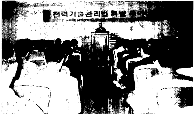
▲ 전력시설물에 대한 설계와 감리가 도입됨으로써 전력기술관리법과 시행령·시행규칙에 관심을 보이고 있다(10월 28일 서울 상록회관에서 개최된 전력기술관리법 특별세미나 모습).