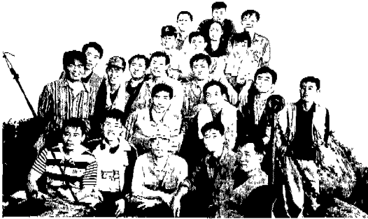
▲ 도봉산 정상에 선 경기북지부 회원들('96. 10. 3)

▼ 개포 5공원 운동장에서 친목도모를 위한 체육행사를 펼치는 서울남동지부('96. 10. 12)