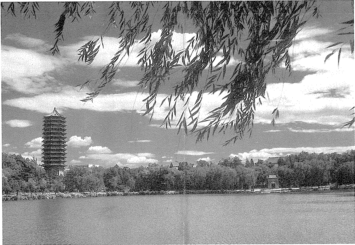
▲ 북경대학 캠퍼스내 미명호(未名湖-앞), 수탑(水塔-왼쪽), 화신묘(花神廟-오른쪽)

(勤奮), 엄근(嚴謹), 구실(求實), 창신(創新)의 교훈이 북경대학의 잘 반영하고 있다.