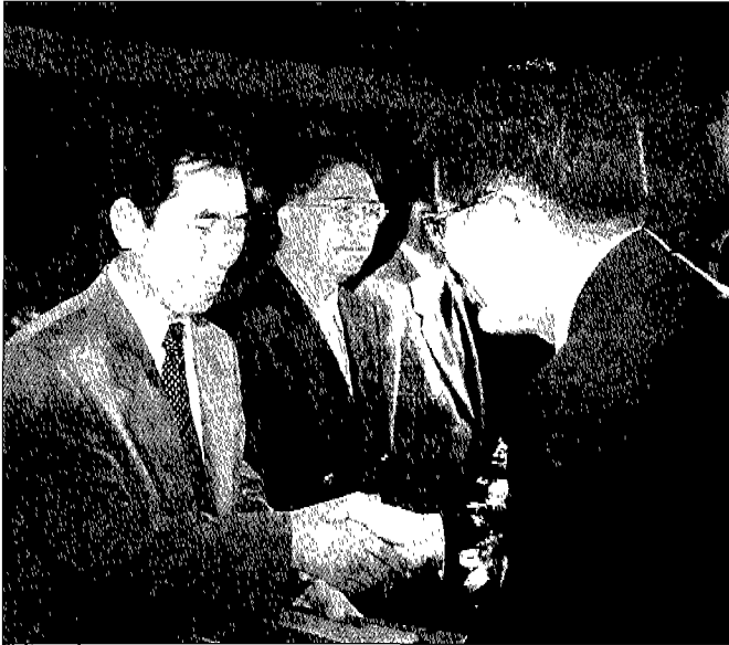
항공우주산업에 기여한 바가 큰 인사에 대해 통산부장관상이 수여되었다.

년대에는 국내 위성수요의 자급은 물론 국제공동개발사업에 주도적으로 참여하고, 발사체 개발능력도 확보함으로써 세계 10대 우주산업국이 될 것으로 예상하고 있습니다.