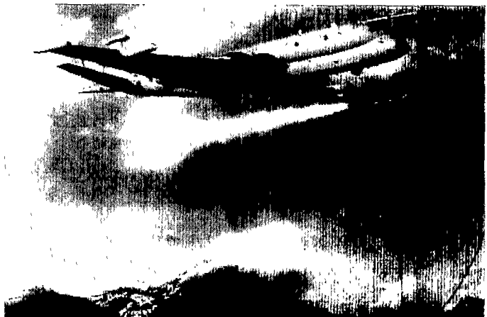
Nimrod 2000: BAe는 새로 제작된 기체의 25년의 수명을 보장할 것이다

한편, 이번 Nimrod 계약으로 롤스로이스사는 BR710엔진, Racal Electronics사는 레이더 장비, GE영국지사와 보잉사의 합작사는 미션시스템을 제공하게 된다.