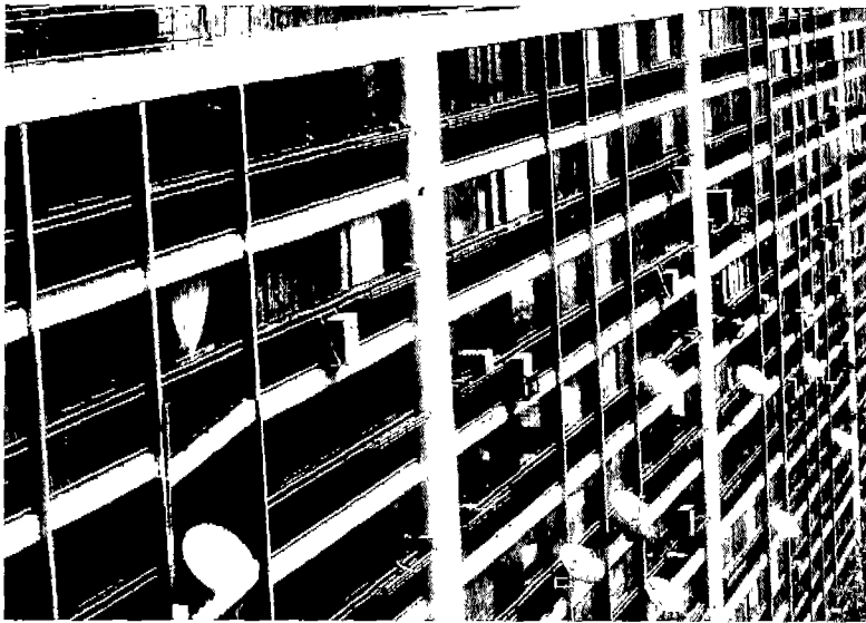
아파트 창가에 설치한 파라볼릭 안테나