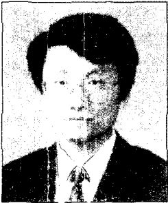
한 만 오 성암여자상업고등학교 교사

환경에 대한 생각을 가지는 것은 바로 생명을 사랑하는 것과 그 맥을 같이 한다.