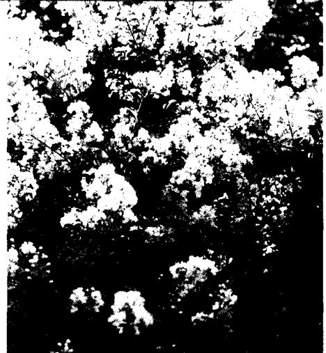
▶ 연분홍색 배롱나무꽃