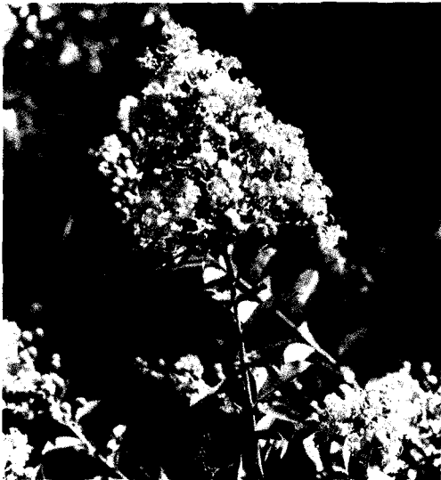
◀ 자색 배롱나무꽃