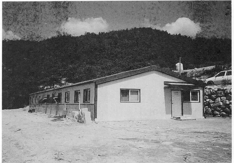
▲ 인공수정센타 건물. 고능력 웅돈들의 안정을 위해 항상 음악을 틀어 놓는다.

인공수정센타(양산시 상북면 신전리)는 부지 800평, 축사 64평, 사무실 그리고 정액제조실로 이뤄져 있으며, 인공수정