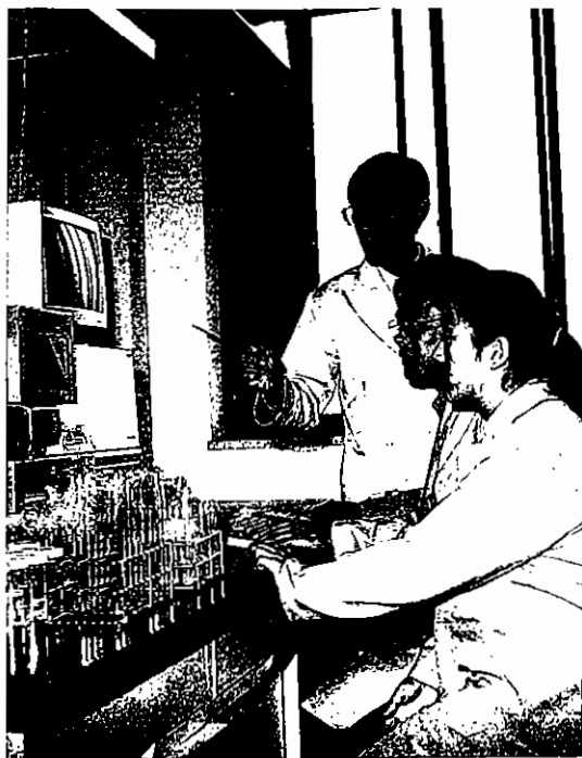
▲ 호남대는 개별화 교수방법에 기초한 교양 세미나 도입, 해외 자매 결연 대학으로의 계절 학기 학생 파견 등 내실 있는 교육에 힘을 쏟고 있다.