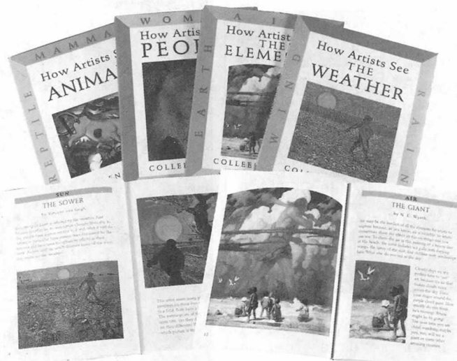
예술가들이 세상을 어떻게 보고 표현했는지 가르쳐주는 '하우 아티스트' 시리즈.

그러고 보면 숭상할 만한 벗은 아득한 옛날에만 있지 않고, 근엄한 활자 속에만 있는 것도 아니며, 숲의 갈피마다에서 불시에 느닷없이 찾아드는 만남 속에도 있는 것이 아닌가. 그 벗은 가던 길에 만난 스님일 수도, 우연히 퍼든 책의 한 면이기도, 아니면 아침 트라에서 만난 친진한 새의 울음소리여서도 좋겠다. 이런 '맛난' 만남이 있어 쓸쓸한 인생이 살아갈 원기를 얻는다. ❖