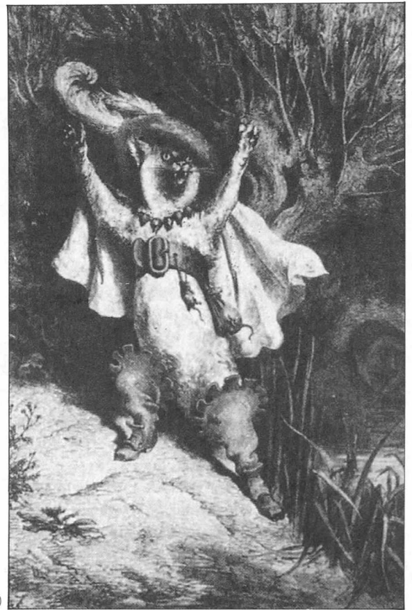
(정화 신은 고양이), 귀스타브 도레, 《고양이 대학살》중에서

《성애의 사회사》는 16세기에서 18세기에 이르는 유럽지역 사랑의 역사를 사회학적으로 재해석하고 있다.