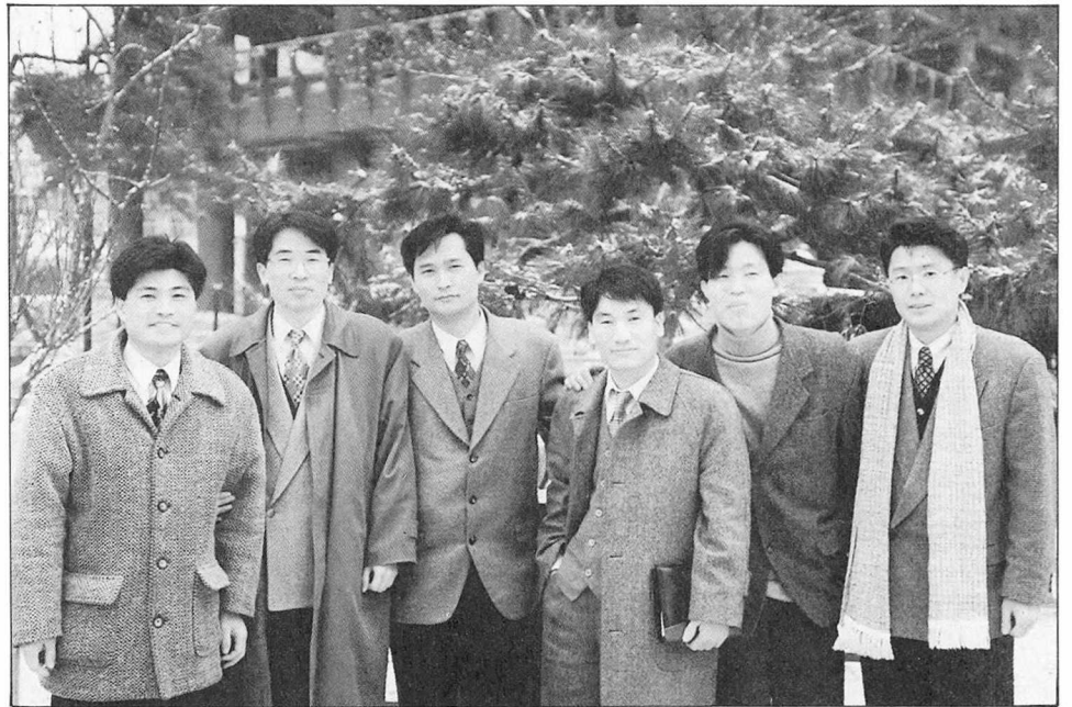
문학출판사들을 중심으로 한 독서토론 모임 ‘베스트 클럽’.

90년대 들어 출판영업인들이 차지하는 위치와 그 의미가 달라지면서 영업인들 스스로 미래를 준비하는 소모임들이 활성화되고 있다.