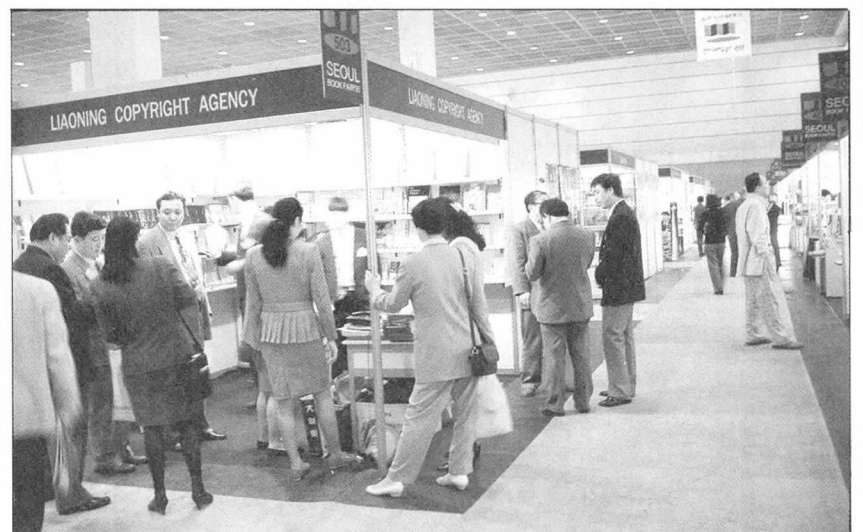
'문학의 해'를 맞아 지난해 퇴조현상을 보였던 소설분야의 상승세가 예상된다(위). 올해도 해외의 각국 출판계와의 활발한 국제 교류가 이뤄질 것으로 보인다.

매는 지난 12월 사무실과 창고를 파주군으로 옮겨 전공정의 전산화 작업을 마무리했다. 또 디딤돌, 나남을 비롯한 출판사들의 공동창고도 부지를 마련했다는 소식이다. 파주단지가 구체화되기 이전에 이미 출판 인쇄 유통 등 관련업체들이 모여들어 파주지역은 올해를 기점으로 새로운 출판메카로 확실히 부각될 듯하다.