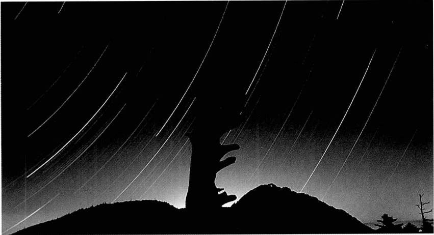
박 명 규 천왕봉의 설화(지리산)