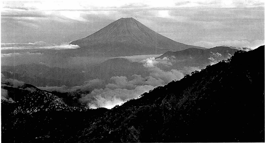
김 순 국 남알프스 설경(일본)