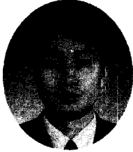
이 주 호*