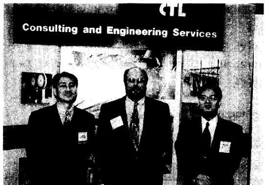
사진 1 참가업체 중 미국의 CTL사 부스에서 (좌측 첫번째가 필자)