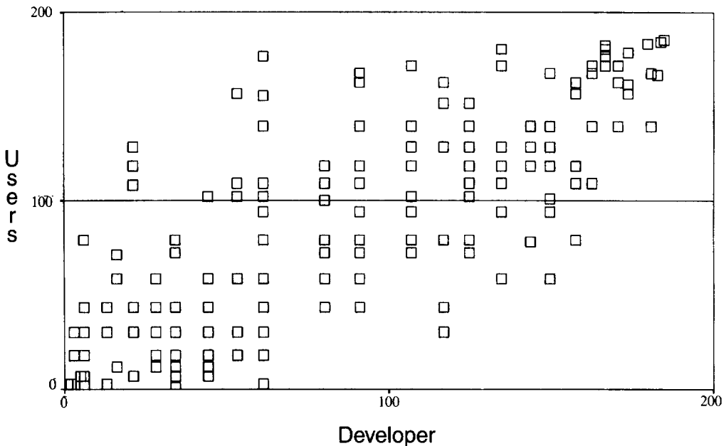
〈그림 1〉 요소별 순위 분포도

평가기준에 중복 포함된 요소 및 이용자와 개발자에게 공통되지 않는 요소들을 제외하면 185개의 요소로 한정된다. 본 조사에서 사용한 통계분석방법은 SPSS를 사용하여 비모수 분석방법 가운데 하나인 Wilcoxon의 양측비교 순위합산테스트(Wilcoxon Matched-Pairs Signed-Ranks Test)를 사용하였다. 데이터가 정규분포를 따르면 T-test가 적합하나 본 조사결과와 경우 데이터가 비정규적으로 분포되어 T-test를 통한 데이터의 분석은 부적합하다. 결국 데이터의 비교분석을 위하여 Wilcoxon의 양측비교 순위합산테스트방법이 채택되었으며, 이 방법은 짝으로 된 두 관측치들 사이의 차이에 대한 부호, 순위의 합계를 대상으로 하는 검증방법이다.