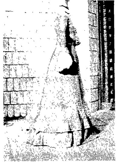
(그림 3) 데이 드레스 측면