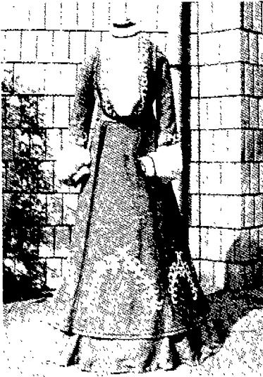
(그림 2) 데이 드레스 정면