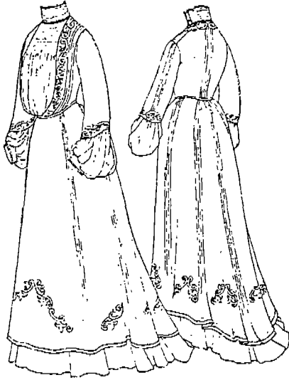
(그림 1) 1902~3년 데이 드레스 (The Gallery of English Costume)

된 마자르(Magyar) 바디스가 나타났다. 본 논문에서 연구된 1902~3년 드레스의 바디스는 언더 바디스는 꼭 맞고 오버 바디스는 앞중심에 주머니 모양의 주름판으로 블루징된 바디스를 이용하여 S자형 실루엣을 보여준다. 이는 세 드레스의 시대