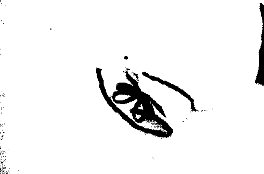
(그림 7) 벨벳리본

언더 스커트의 밑단에는 두단의 프릴(frill)이 달린 플라운스가 연결되고 각 패턴이 곡선으로 처리되어 허리부분은 꼭 맞으면서 아래로 내려갈수록 A자형으로 퍼지는 고어 스커트와 함께 스커트 아래로 퍼지는 실루엣을 형성하고 있다.