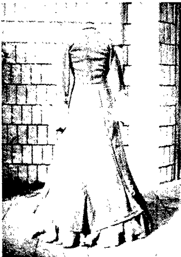
(그림 4) 데이 드레스 뒷면