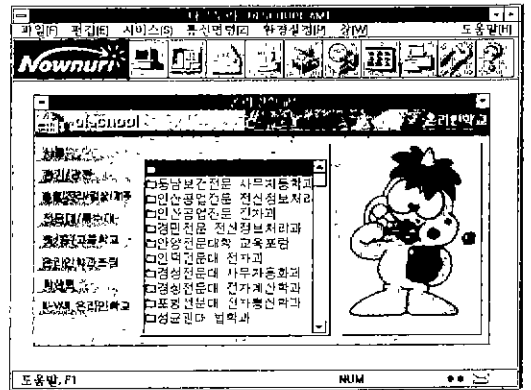
<온라인학과 포럼 초기화면>

[온라인 학과 포럼]은 자료실, 재택강의, 온라인 게시판 등 여러 가지 방안으로 활용될 수 있어 학생들이 정보화사회에 앞서나갈 수 있는 좋은 토대로 마련해 줄 것입니다.