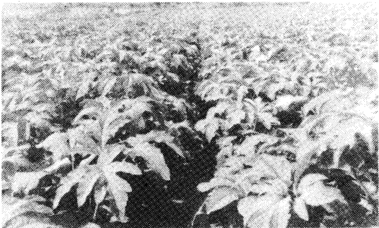
◇ 토당귀 식물