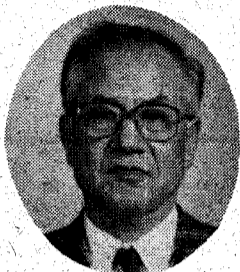
이 학 중 〈단국대 교수〉

순환기질환이 세인의 이목을 끌게 된 것은 1960년대로 고혈압성 심부전, 뇌졸중, 약성 고혈압 환자가 많이 발생하기 시작하였다. 이것은 그 이전까지만 해도 국민의 주요 사망원인 이었던 결핵이 효과적으로 치료될 수 있는 방법이 생기자 국민의 평균 수명이 50세를 넘기면서 본태성 고혈압의 자연경과에 따라 고혈압을 가진 상당수의 환자가 50세를 전후하여 여러가지 고혈압의 합병증을 일으키게 되었기 때문이다. 고혈압은 그 본질이 증상이 없다는 것이 특징이다. 증상이 있다하여도 즉시 치료에 착수해야 할 만큼 심한 증상이 있는 일은 드물다. 심부전, 뇌졸중 등 합병증이 생겨야 비로서 치료의 필요성을 깨닫게 된다는 것이 고혈압의 함정이라 하면 틀린 말이 아닐 것이다. 1960년대에는 일반국민의 고혈압에 대한 인식이 없었던 것은 물론이고, 관심이 있다하여도 치료수단도 거의 없었다. 효과적인 치료약제가 아직 개발되