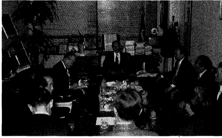
■ 박광훈 수산청장은 1월12일 협회를 초도순시하고 어항을 수산업과 어촌사회의 핵으로서 개발해야 한다고 강조했다.

技術 개발·制度 개선등 모색 당부 漁港 工事 대형화에 적극 對應토록 孫희장 보고 政府 受託사업 수용에 萬全 박광훈 수산청장은 지난 1월 12일 한국어항협회 회를 초도순시, 을해사 해서는 부실시공이라는 업계회를 보고받는 자리에서 지난해 성수대교 붕괴를 비롯한 각종 불미스러운 사고들을 이날 참석한 회장단에게 상기시키고, 우리 어항업계는 이점을 깊이 느끼고 반성하는 계기로 삼아 어항공사에 관대우 적었으나 올해부터 어항시설 물량을 감안, 수산청은 을해 1천92억 8천만원으로 55개 어항에 대해 계속투자 및 정비확장, 보수보강공사를 추진할 방침이다. 수산청은 대폭 늘어난 어항시설 물량을 감안, 조기설계를 추진함에 따라 2월말 2월말순이후 부터 각 항별도 계약요청, 에 들어갈 것으로 전망, 내년의 비해 2개월정도 앞당겨 배정 내역은 다음과 같다.