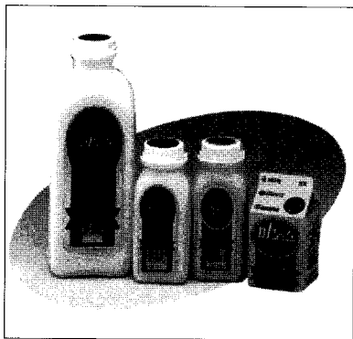
▲ 개폐가 용이해 보관이 가능한 미노스 우유

기존 우유에 철분·칼슘·비타민 D를 더욱 강화시킨 고품질 영양우유로 성장기 어린이, 여성빈혈, 성인의 골다공증, 구루병의 예방에 좋은 제품이다.