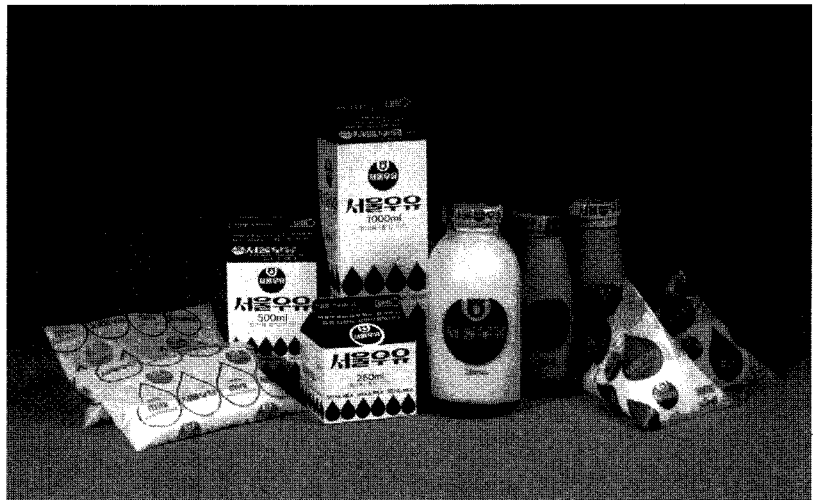
▲ 사진으로 보는 서울우유 포장디자인의 변천사

58년의 유구한 역사를 자랑하는 서울우유협동조합은 보다 나은 질의 유제품 생산과 공급, 완전식품인 우유의 가공산업과 낙농업의 선진화를 선도하여온 국내 유제품 업계의 선두 주자이다.