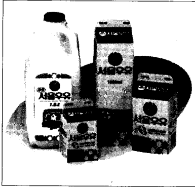
▲ 서울우유 시유