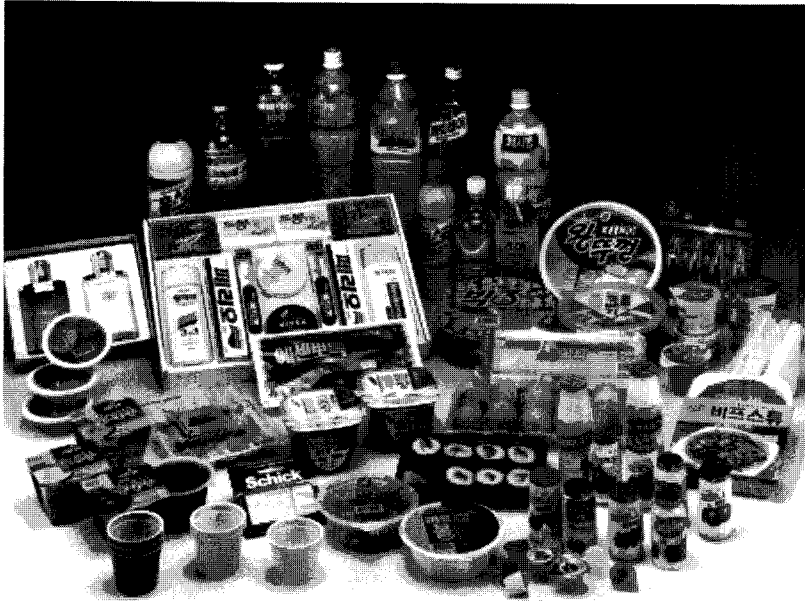
▲ 동성화학에서 생산된 필름으로 포장한 제품들

및 전입원료 등에 대한 가격동향, 시장조사를 통하여 정확한 비판력으로 신속하게 대처하기 때문에 현재 원료 조달에는 큰 어려움이 없으나, RESIN 원료의 경우 전량 석유화학 제품으로서 원유가 등락의 영향이 매우 민감하여 국제유가의 파동시에는 가격 앙등과 함께 원료조달의 적