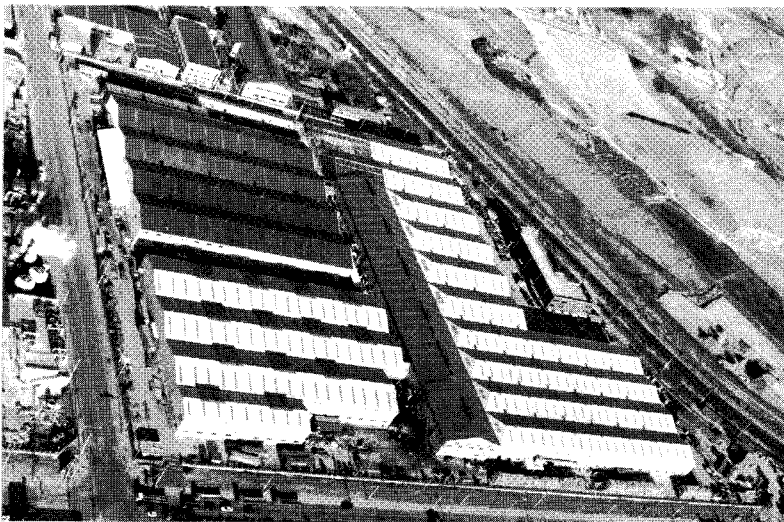
▲ 하늘에서 본 태림포장의 규모는 실로 어마어마하다. 지속적인 증설을 꾀하고 있는 태림은 업계 최고의 자리를 굳건히 지키고 있다.