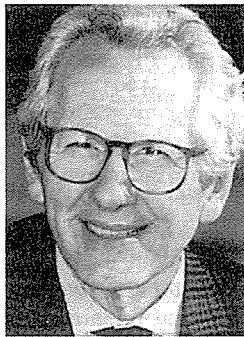
▲남성요인의 불임증 치료에 성공한 연구팀의 반 스타이어테겔

이 논문들은 여러 원인 가운데 운동성 정자의 수가 불충분하기 때문에 표준 체외수정(IVF)에 실패한 부부를 치료하기 위해 개발된 여러가지 체외수정을 설명하고 있다.