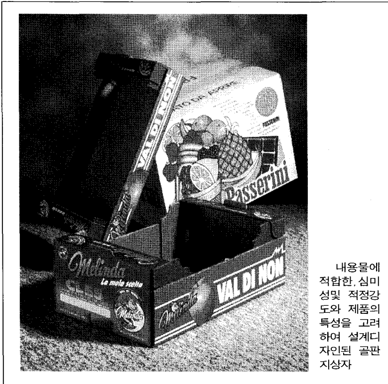
내용물에 적합한, 심미성 및 적정강도와 제품의 특성을 고려하여 설계된 골판지 상자

며, 나아가서는 국가 경쟁력 저하라는 엄청난 부작용을 수반할수도 있기 때문이다.