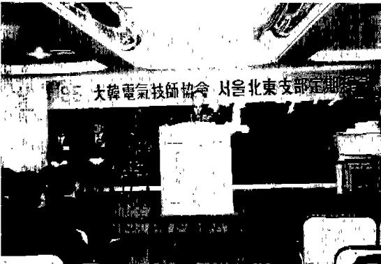
▲ 서울 북동지구 '95 정기총회

• 기타사항 : 정관개정-원안대로 통과 회관관람상금·모금 적극 추 진 결의함.