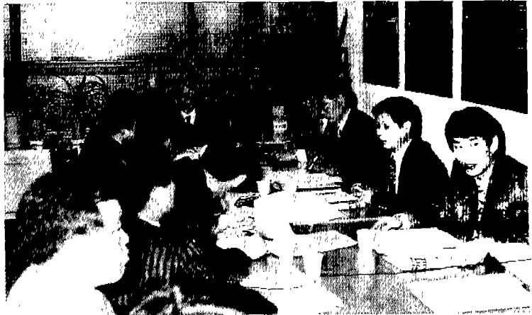
▲ 비상대책단 회의

지난 2월 6일 협회 회의실에서 국가경쟁력강화기획단의 전기안전관리담당자 의무고용제 폐지(안)에 대하여 협회의 능동적 대처방안을 수립하고 회원의 역량을 결