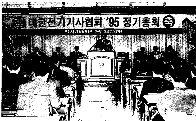
▲ 대한전기기사협회 '95 정기총회